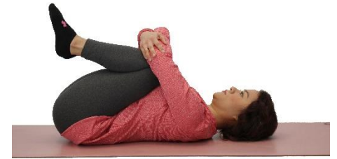
Rodillas al pecho

Desde la postura del ángulo abierto, coloca la planta del pie derecho bien sobre la cara interna del muslo izquierdo. Mantén la pierna izquierda enderezada con los dedos de pie hacia el techo. Exhala, dobla adelante por la cintura y alcanza hacia el pie izquierdo. Baja el torso hacia la rodilla izquierda. Cambia al otro lado.