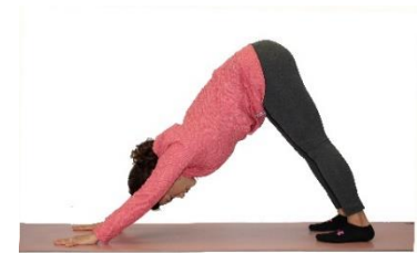
Perro boca abajo

Desde la postura de la montaña, exhala, levanta rodilla izquierda y crúzala sobre el muslo derecho. Apunta con los dedos e intenta enganchar detrás del gemelo derecho. Inhala, estira los brazos adelante. Exhala, cruza los brazos con el derecho encima doblando los codos y enfrentando las palmas entre sí. Cambia al otro lado. Nota: Esta postura es avanzada. Modificaciones: Hacer la postura mientras estar sentado o hacer la parte inferior del cuerpo aparte mientras agarras una silla y luego la parte superior mientras estar parado o sentado.