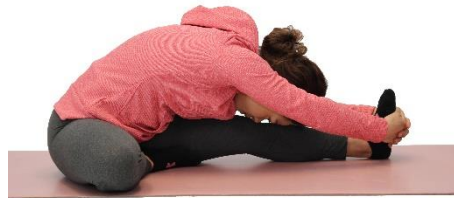
Cabeza a la rodilla

Ángulo abierto: Desde la postura del zapatero, separa las piernas hasta que te sientas estirado. Dirige las rodillas y los dedos de pie hacia el techo. Siéntate con la espalda recta, e inclina el tronco hacia adelante y exhala mientras estiras las manos adelante.